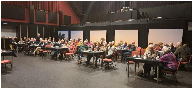
Ontvangst in de Pas in Heesch