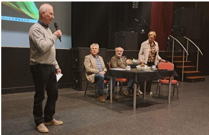
Woordje van de kringvoorzitter