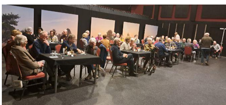
De zaal wacht geduldig af