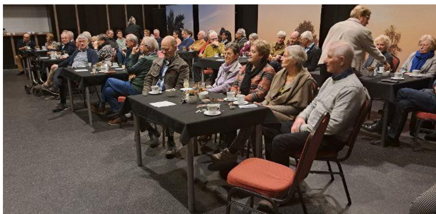
De aanwezigen luisteren aandachtig en geamuseerd